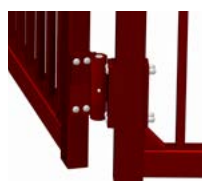
Gångjärn som klarar upp till 400 kg.