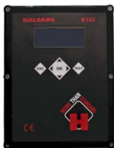
Elskåp med en Halsang H102-styrenhet och frekvensmodulatorer