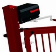
Motor och växellåda i hög kvalitet.